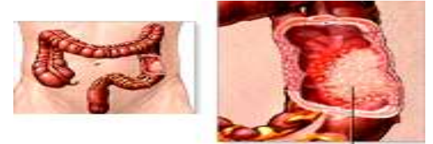
سرطان روده بزرگ

سرطان نوعی بیماری است که در آن سلولهای غیرطبیعی در بعضی از بافتها یا اعضای بدن خارج از کنترل طبیعی شروع به رشد و افزایش تعداد می کنند. در زمان حیات سلولهای طبیعی بدن در طی یک روند کنترل شده بازسازی و تکثیر می شوند. این امر باعث رشد طبیعی بدن و ترمیم بافتهای صدمه دیده و زخمها می گردد. وقتی که سلولها خارج از چهارچوب طبیعی رشد کنند، توده ای از سلولها را به وجود می آورند که به آن تومور می گویند. بعضی از تومورها فقط در مکان ایجاد خود رشد کرده و بزرگ می شوند که به آنها تومورهای خوش خیم می گویند، بعضی از تومورها نه تنها در محل پیدایش خود رشد می کنند، بلکه توانایی تهاجم و تخریب بافتها و اعضاء اطراف را داشته و می توانند به نقاط دوردست بدن گسترش پیدا کنند. این تومورها را تومورهای بدخیم یا سرطانی می گویند. گسترش به نقاط دوردست بدن هنگامی اتفاق می افتد که سلولهای بدخیم از محل اولیه خود جدا شده و از طریق جریان خون یا دستگاه لنفاوی بدن منتقل گشته و در نقاط جدید تومور جدیدی را ایجاد نمایند. به این تومورهای جدید متاستاز می گویند.