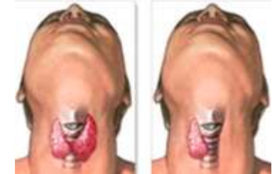
برداشتن قسمتی از تیروئید در سرطان آن

در این روش تمام و یا بخشی از غده تیروئید توسط جراح برداشته می شود. تیروئیدکتومی کامل ممکن است به عنوان اولین درمان سرطان تیروئید، انجام شود.